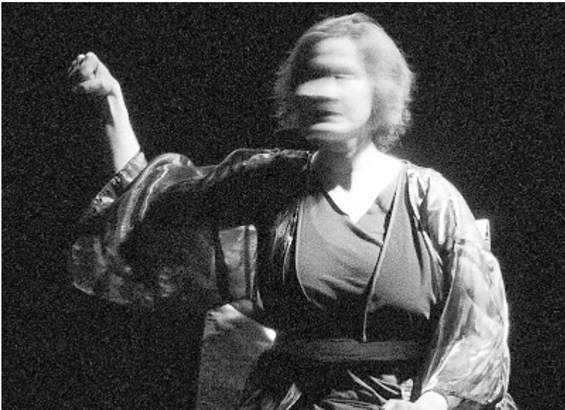
Como una fruta madura.