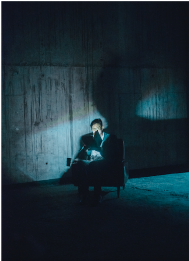
Ansío Los Alpes. Así Nacen los Lagos. Versión 3.

Obtenido de « http://plataformanodos.org/index.php?title=Carolina_Donnantuoni&oldid=6411 »