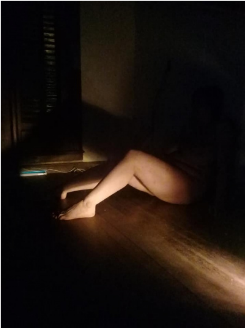
Esto NO es La Metamorfosis de Franz Kafka. Rebocetado del Boceto 1.